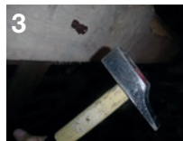
3 Pose d'injecteurs bois pour diffuser le produit au cœur du bois Injecteurs bois à bille ø 9,5 mm (réf. 609 500)

Injection du produit de traitement de bois D'XYL dans tous les trous Pompe d'injection Pan 15/18 (réf. 518 025)