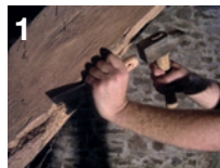
1 Buchage des parties attaquées et balayage des poussières

• Après utilisation, rincer le matériel et les équipements à l'eau.